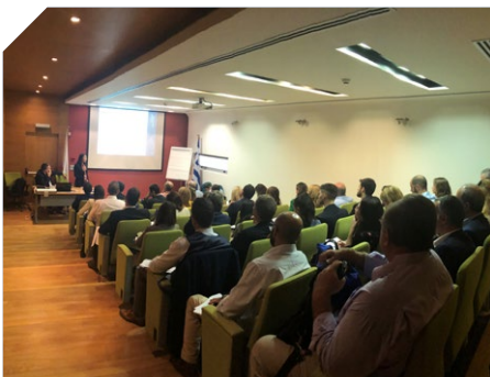
比雷埃夫斯研讨会 10月份的研讨会在内部礼堂举行

协会的秋季委员会会议于10月在汉堡举行，随后在辉煌的英德俱乐部举行了接待会。此次活动成功的举办是为了表示协会对德国航运市场上会员和伙伴们持续支持的感谢。