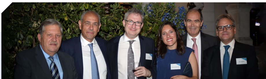
与会员和伙伴会面