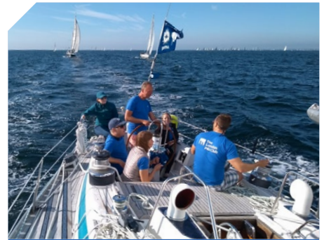
彼得·加斯特帆船赛 (Peter Gast regatta) 协会船员和来宾取得了良好的进步