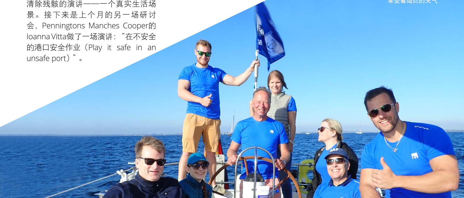
彼得·加斯特帆船赛 (Peter Gast regatta) 船员和宾客们在帆船赛中 享受着灿烂的天气